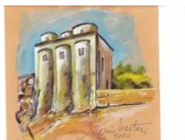
chiesa di San Marco (metà dell'XI secolo)

ISTITUTO COMPRENSIVO STATALE "A. AMARELLI" VIA GRAN SASSO n. 16 - 87068 ROSSANO - TEL.0983512197 - FAX 0983291007